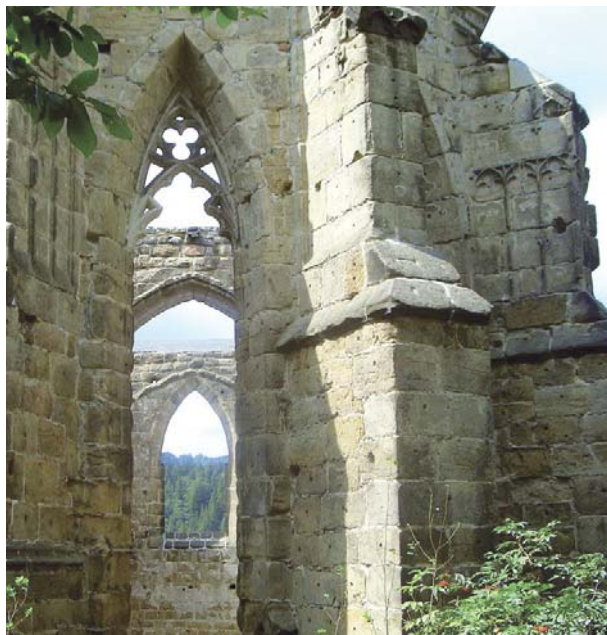
Ojbín