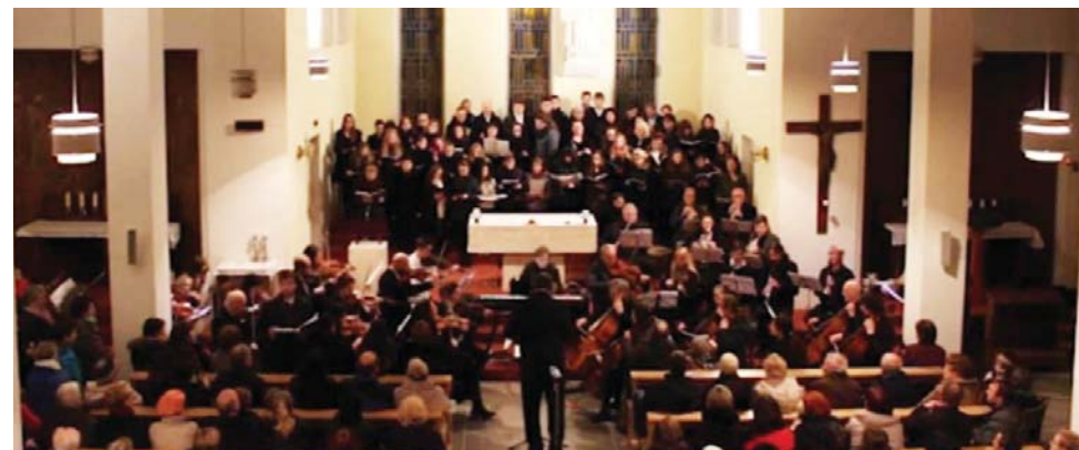
Zaplněný kostel účinkujícími i posluchači při Rybově mši vánoční 19. prosince 2016.