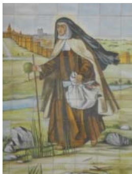
sv. Terezie, Cordoba 2015