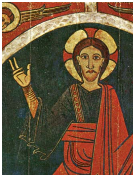
Katalánská nástěnná malba, 12. stol.

Myslím, že pravý křesťan musí mít v sobě stejně jako náš Pán zřetelné stopy lidství i božství. Lidství v jeho důstojnosti a jemnosti k sobě i v pohledu na ostatní. Božství skrze Ducha Svatého, který v nás od křtu a biřmování přebývá a kterého stále můžeme nově přijímat a nově objevovat. Tedy zvláště v této době před Letnicemi se spojme ve společném i osobním zvolání: