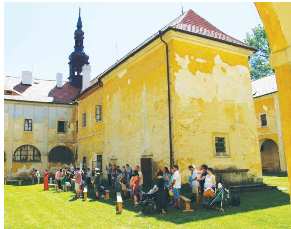
Farníci při bohoslužbě v Hájků