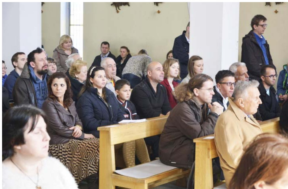
Iráčané v našem kostele