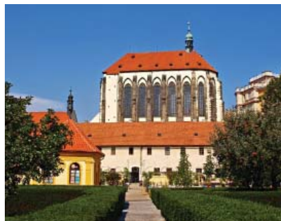
Kostel P. M. Sněžné