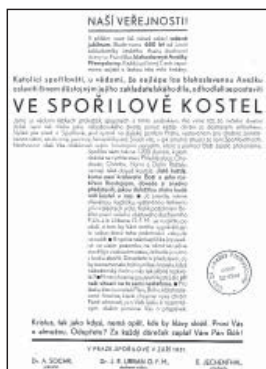
Plakát sbírky na kostel