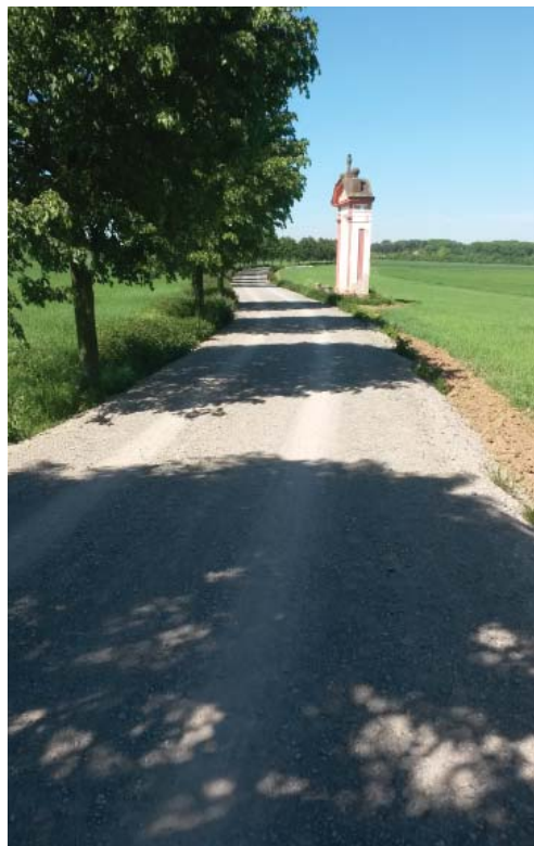
Poutní cesta do Hájků